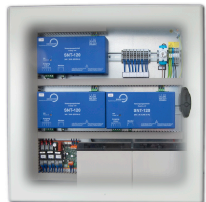
ST4 3328 AEV-72 600 x 600 x 250 mm

Alle AEV beinhalten die Stromversorgung mit Ladekarte und Akkus nach DIN EN 12101-10. Die Abgangsklemmen sind vorbereitet zur Übergabe an die bauseits installierte Steuerung.