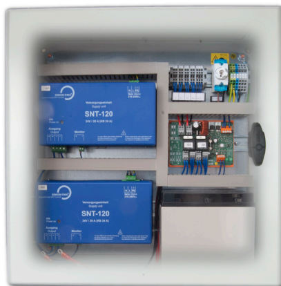
ST4 3327 AEV-48 500 x 500 x 200 mm